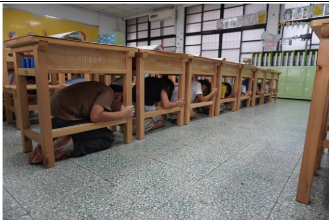
地點：吉慶國小 時間：1130920 說明：於班級中實際練習 趴下、掩護、穩住的動作