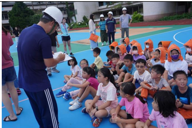
地點：吉慶國小 時間：1130920 說明：進行請點人數