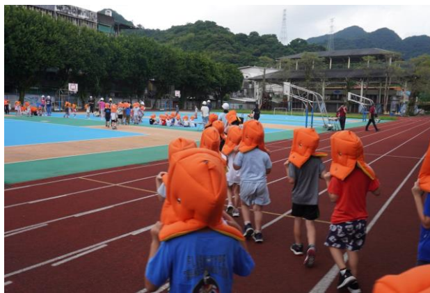
地點：吉慶國小 時間：1130920 說明：進行疏散