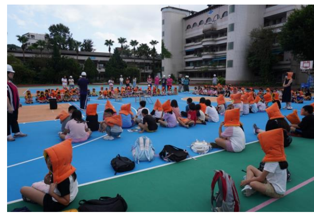
地點：吉慶國小 時間：1130920 說明：各班操場集合